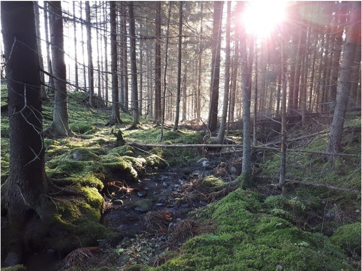
Kuva 2. Luonnontilainen / luonnontilaisen kaltainen noro (VL 11§).

Metsikön poikki virtaa pohjoisesta vanhalta pellolta noro, joka on metsässä uomaltaan pääosin luonnontilainen. Pellolla uoma on suoristettu. Metsässä kulkevalta osuudeltaan noro on tulkittavissa vesilain 11§ mukaiseksi kohteeksi (kuva 2). Pykälän mukaisten vesiluontotyyppien luonnontilan vaarantaminen on kielletty. Noron tuntumassa kasvaa metsäkerros- ja metsäliekosammalen lisäksi muun muassa metsäälvejuuri, sinivuokko ja rönsyleinikki. Noro laskee Asuntilanjokeen.